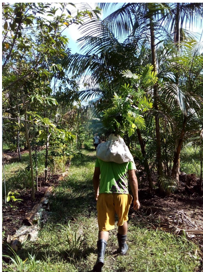
Foto 4: Transporte alternativo de mudas para o campo. Colaborador: Simão Erinei da Silva Santos. Fonte Trabalho de campo Eco Fazenda Escola Patú Anú