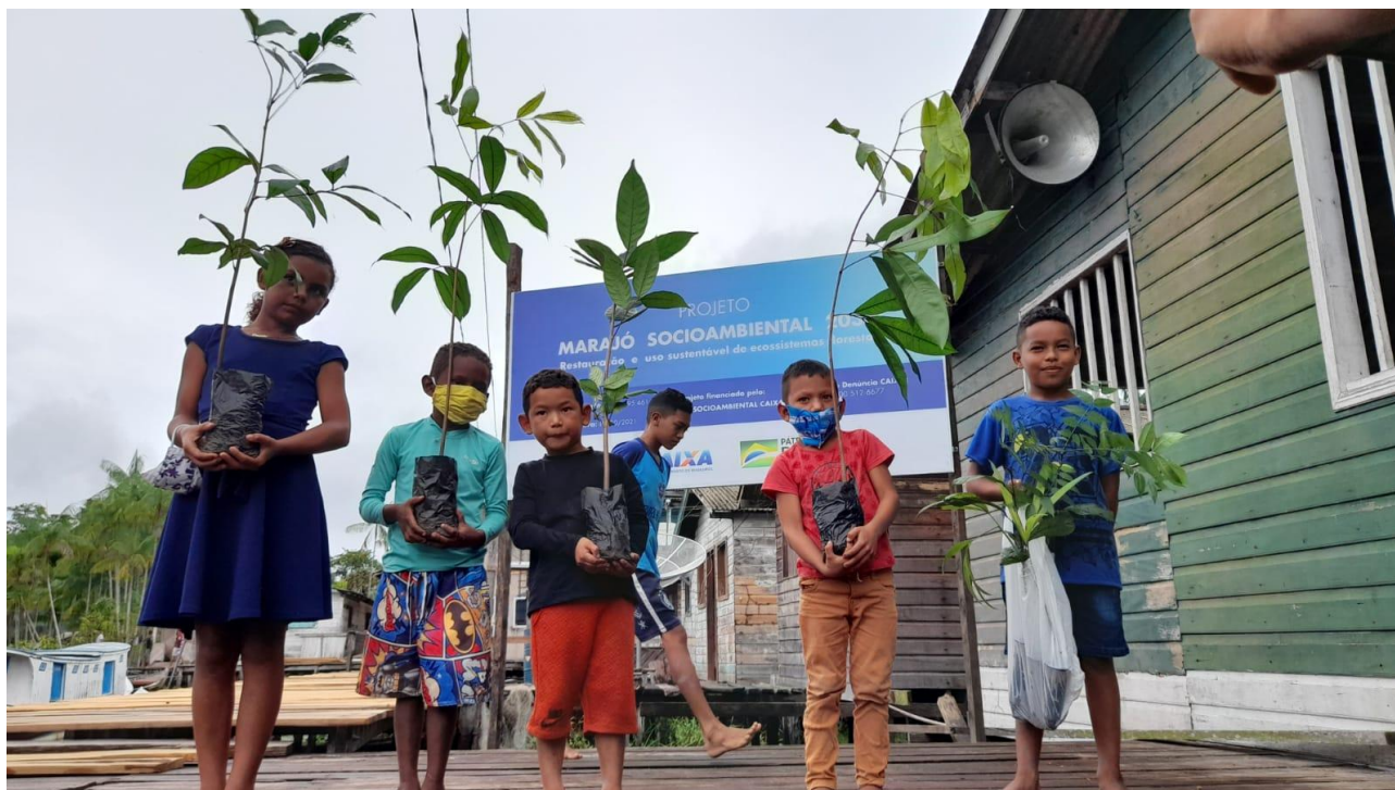
Foto 2: Comunidade de Santo Ezequiel Moreno em Portel/PA na ocasião da visita da equipe técnica da Caixa e do Fundo Socioambiental.